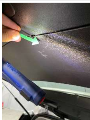
Фото царапин салона