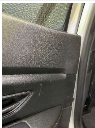
Фото царапин салона