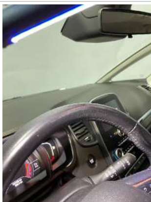
Фото царапин салона