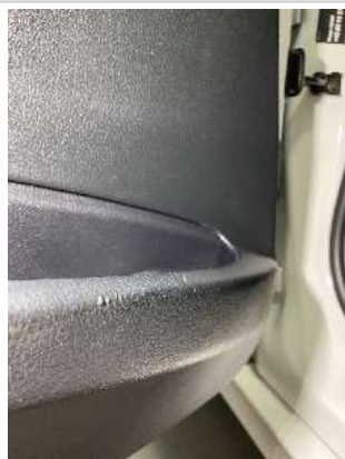
Фото царапин салона