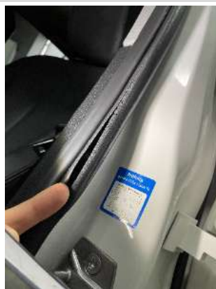
Фото царапин салона