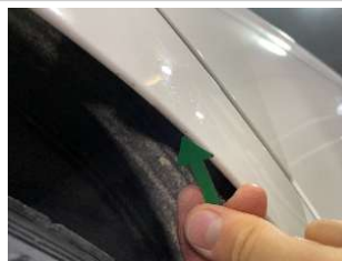
Царапины на заднем крыле