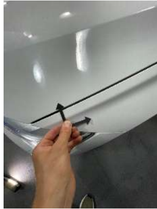
Царапины на капоте