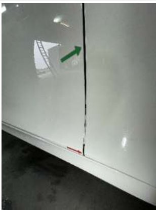
Царапины на двери ПП