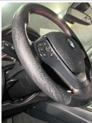
Фото царапин салона