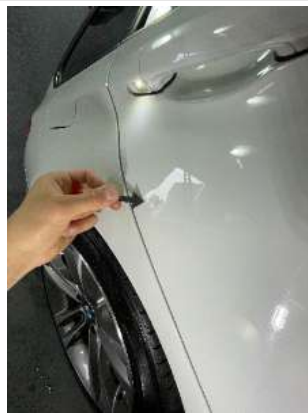
Царапины на двери ЗП