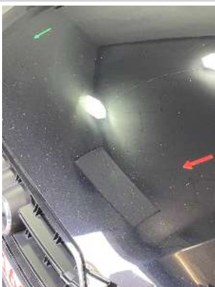
Царапины на двери ПП