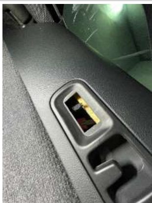
Фото царапин салона