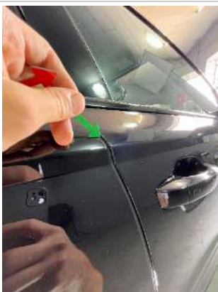
Царапины на заднем крыле