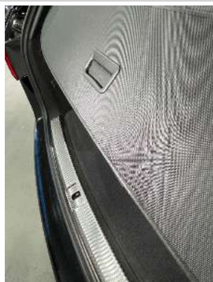
Фото царапин салона