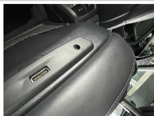
Фото царапин салона