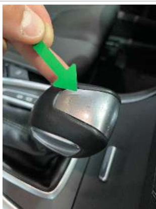
Фото царапин салона