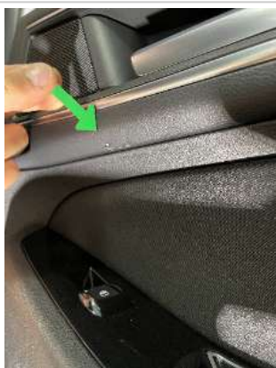
Фото царапин салона