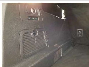
Фото царапин салона