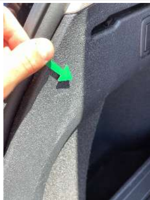
Фото царапин салона