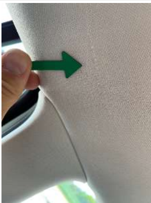
Фото царапин салона