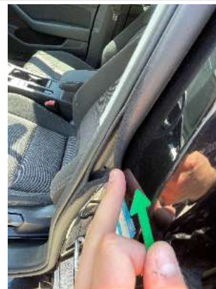
Фото царапин салона