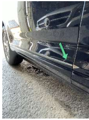
Царапины на заднем крыле