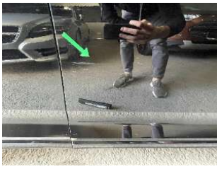
Царапины на заднем крыле